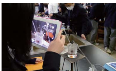
写真2: カメラ機能を使って実験の過程や結果を撮影