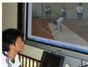
前時に撮影した個々の演技を見る