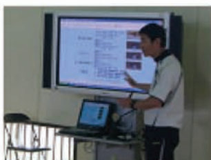
Web教材の模範演技を見る