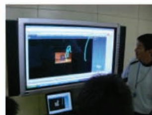
Web教材の模範演技を再度見る