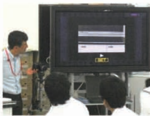
等速直線運動をビデオのスロー再生で観察