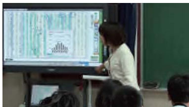
写真1: デジタル教科書で推敲の観点を確認