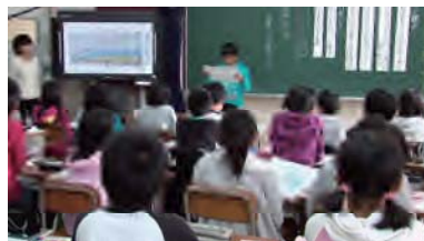
写真2: 実物投影機で児童同士推敲しあった意見文を提示